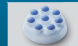
nakładka z wypustkami masującymi