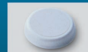
nakładka z mikrowłókien (do masażu stóp)